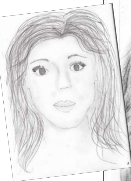
Kresba v první den kursu a kresba v druhý den kursu.